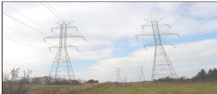
Figure 2: Two High Voltage Double-Circuit Transmission Structures

There are several different kinds of transmission structures which can be constructed of metal or wood. They can be single-circuited , carrying one set of transmission lines or double-circuited with two sets of lines. Figure 3 shows an example of high voltage double-circuited transmission structures.