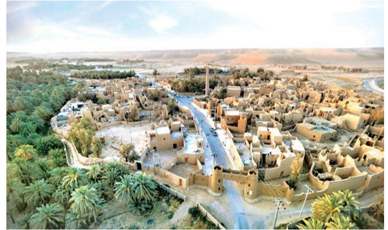
بوابة الدرعية القديمة