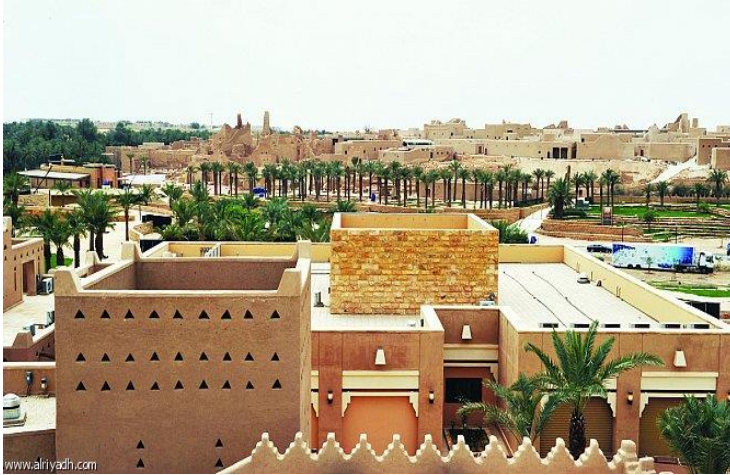
الدرعية بعد تاهيلها والتطوير