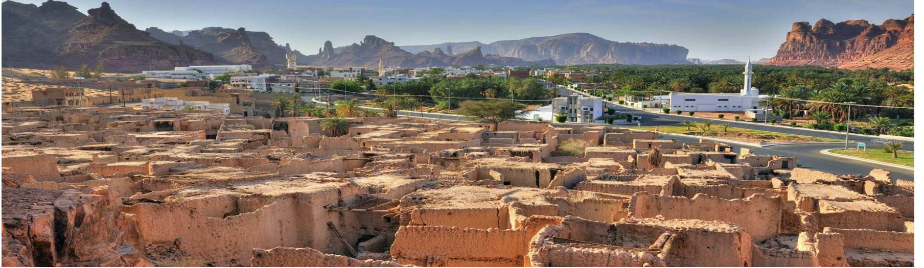
الزحف منطقة تراثية