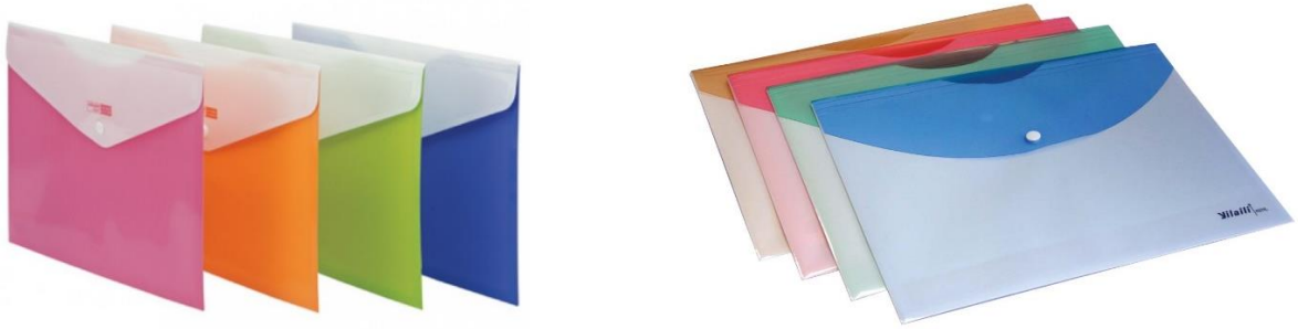
شكل الحقيبة البلاستيكية