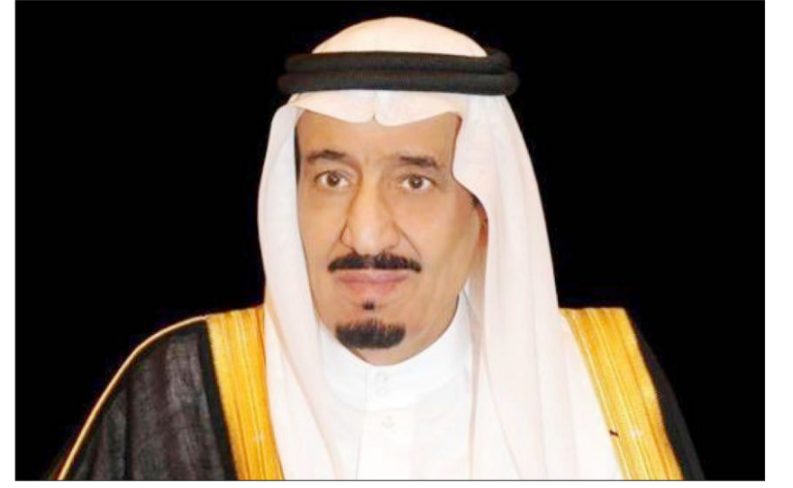
الملك سلمان بن عبدالعزيز

أكد خادم الحرمين الشريفين الملك سلمان بن عبدالعزيز، إدانة المملكة وشجبها للاعتداءات والإجراءات الإسرائيلية في مدينة القدس، والعدوان الإسرائيلي على قطاع غزة، وما أسفر عنه من سقوط للضحايا الأبرياء والجرحى، داعياً الله عز وجل