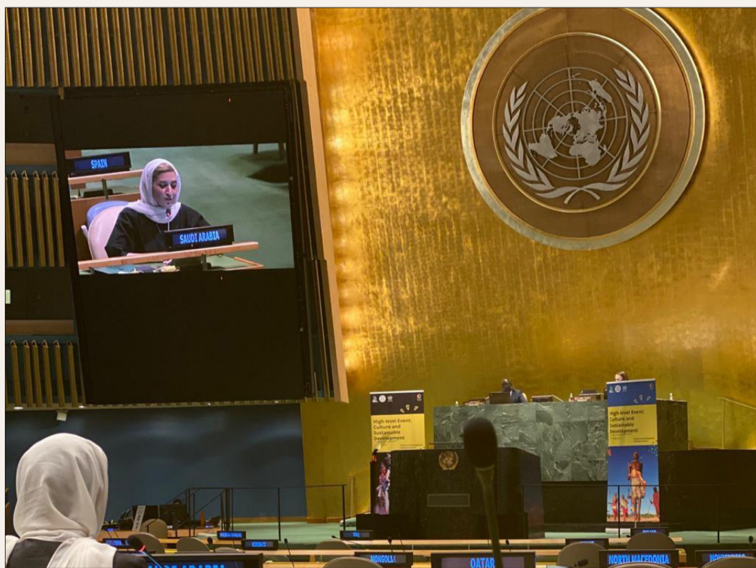
سارة عاشور تلقي كلمة المملكة في اجتماع الجمعية العامة للأمم المتحدة (واس)

أكدت المملكة مضيها في ترسيخ حضور الثقافة بجميع أنماطها في مختلف مناحي الحياة بشكل يتواءم مع رؤية المملكة 2030 وأهداف التنمية المستدامة 2030، ومنطلقة في مسيرة الاستراتيجية الثقافية الوطنية من إيمان راسخ وعميق بأهمية الدراسات والأبحاث للنهوض بالقطاع الثقافي بوتيرة مستدامة.