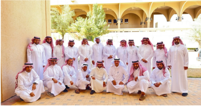
صورة لعددٍ من أعضاء هيئة التدريس بالكلية، التُقطت في شهر أغسطس 2025م.