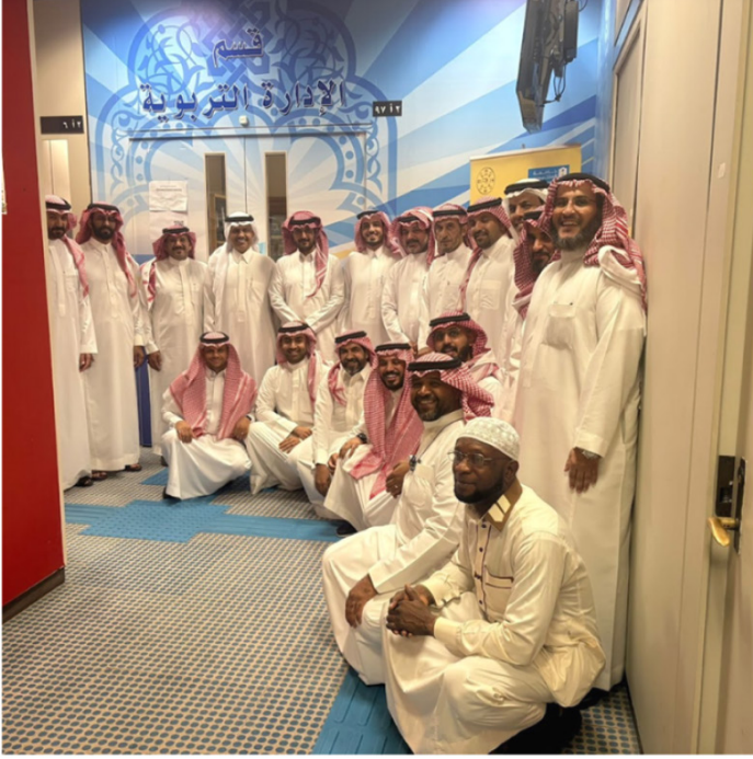
صورة لطلاب الاختبار الشامل قبل بداية الاختبار الأول، وذلك يوم 18 سبتمبر 2025م.