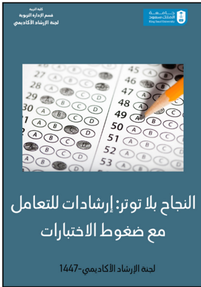
غلاف كتيب النجاح بلا توتر: إرشادات للتعامل مع ضغوط الاختبارات

مع دعواتنا لكم بالتوفيق، لجنة الإرشاد الأكاديمي.