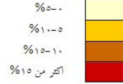
شكل رقم ٢. الإنتشار المكاني لمواقع التراث العمراني في المملكة العربية السعودية