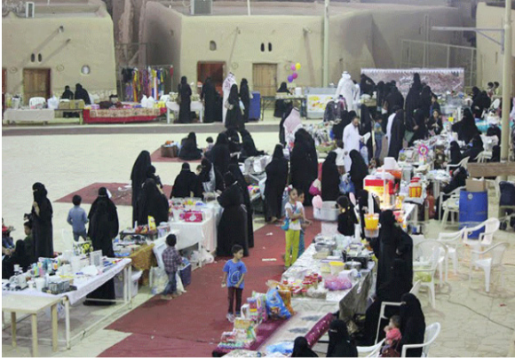
د. منتجات غذائية متنوعة في قرية الخبراء التراثية