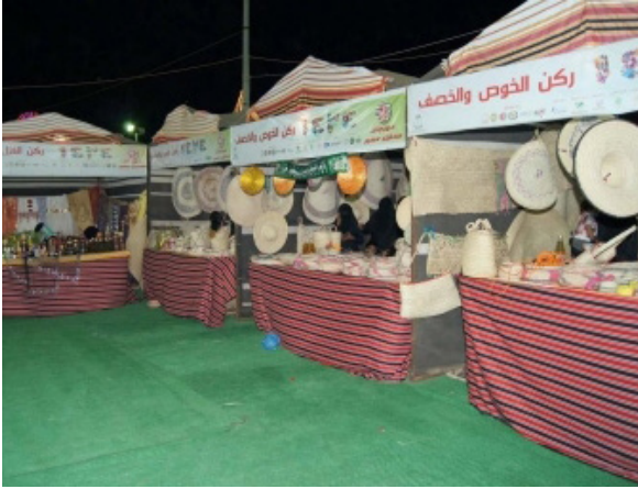
هـ. فن القط، اشهر الفنون في رجال المع و. مهرجان الثقافة والتراث، قرية رجال المع التراثية