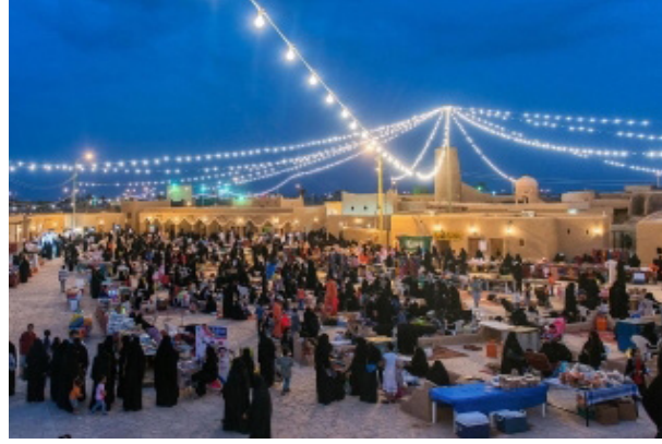
ج. مهرجان قرية الخبراء التراثية