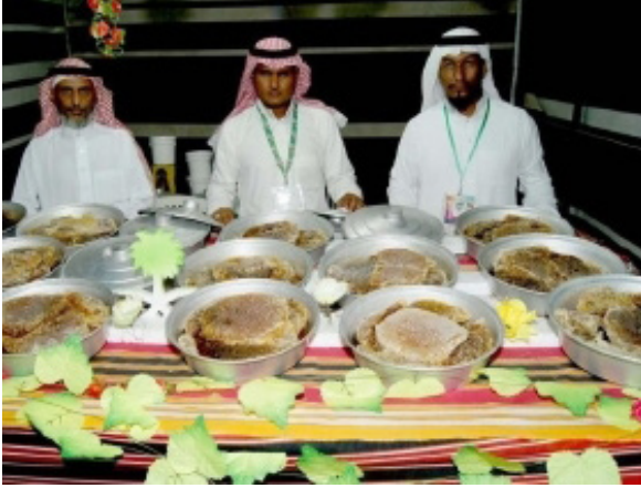
ب. مهرجان العسل في رجال المع

وأخيراً يلخص الشكل رقم ٤. أبرز أمهات الإنتاج الإقتصادي للأسر في مواقع التراث العمراني إستناداً إلى المعارض الموسمية والمهرجانات المقامة ضمن برامج إستثمار المواقع التراثية.