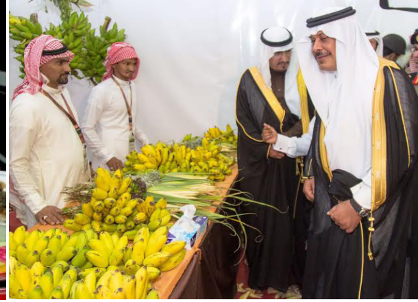
أ. مهرجان الموز والكادي بقرية ذي عين التراثية