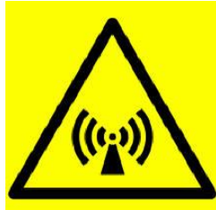
اشعاعات غير متأينة