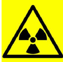
مصدر إشعاع خطر