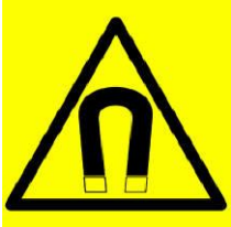
مجال مغناطيسي قوي

• يجب أن تكون صنابير المياه بعيدة عن الكهرباء والأجهزة