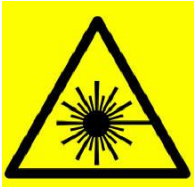
مصدر ليزر خطر

• التأكد من خط الكهرباء (١١٠ أو ٢٢٠ فولت) قبل توصيل الأجهزة