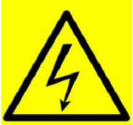
تيار كهربائي عالي الفولتية

• يجب أن تكون صنابير المياه بعيدة عن الكهرباء والأجهزة