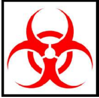
مادة خطرة بيولوجيا