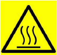
سطح ساخن جدا

• صيانة الأجهزة بشكل دوري وتنظيفها • مراقبة الأجهزة أثناء التشغيل وإطفاءها بعد الانتهاء من الاستخدام