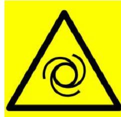
جهاز يشتغل عن بعد