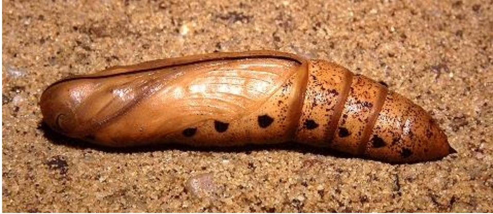
عذراء دودة التفلة

http://tpittaway.tripod.com/sphinx/d_ner.htm