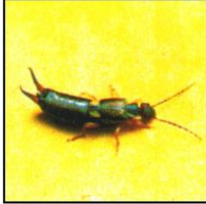
أبو المقص ( إبرة العجوز )

أبو مقص هو عبارة عن حشرة معروفة بأن لها ذبلاً يشبه المقص ، صغيرة الحجم طولها 2-3 سم مسودة اللون تعيش على المواد والفضلات العضوية الموجودة في التربة حول النباتات وتتغذى على بعض الأنسجة النباتية كالأزهار والثمار والبراعم فتشوهها. وتعيش هذه الحشرة حول معظم أنواع النباتات في الحدائق.