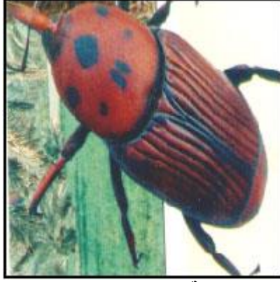
سوسة النخيل الحمراء