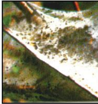
اليرقات والديدان في الأوراق النباتية

وهي عديدة الأنواع والأشكال . وهي عبارة عن يرقة تأكل الأوراق وتعيش عليها وتشاهد بالعين المجردة وبعض أنواعها كبيرة قد تصل إلى حوالي 10 سم. وتصيب كثيراً من الأنواع النباتية والشجرية.