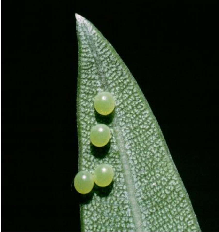
بيوض دودة التفلة