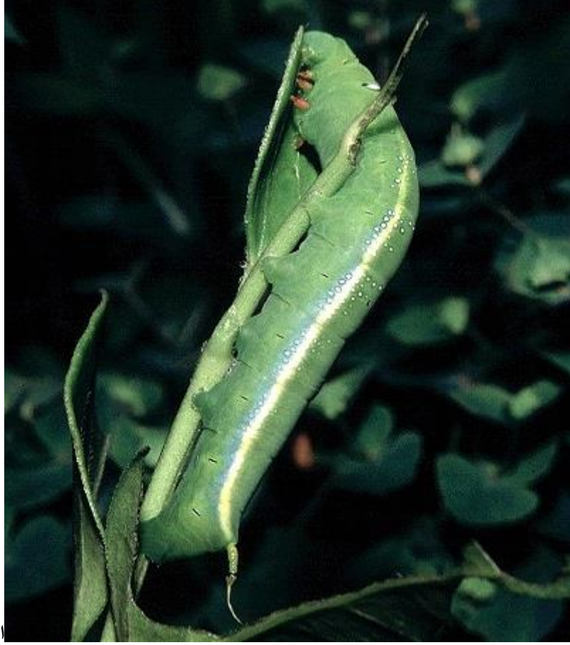
يرقة دودة التفلة