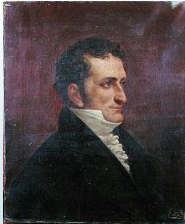
Itard (1774- 1838)