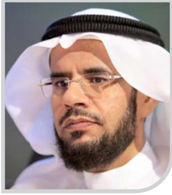
أ.د. فهد بن سليمان الشايخ عميد كلية التربية بجامعة الملك سعود رئيس مجلس إدارة الجمعية السعودية للعلوم التربوية والنفسية