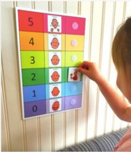
صورة (٤): لوح للتعبير عن المشاعر (AMAZON, 2022)

يواجه الأفراد ذوي اضطراب طيف التوحد صعوبات متعلقة بفهم المشاعر و التعبير عنها و تنظيم الانفعالات. يستخدم لوح التعبير عن المشاعر لمساعدة الطفل على تيسير التواصل و التعبير عن المشاعر و فهمها.