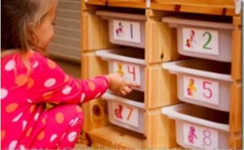
صورة ٦: (توظيف جدول عمل في ركن تعليمي

يستخدم جدول العمل لتنظيم عمل الطفل في الأركان التعليمية في البيئة الصفية. قد يكون عبارة عن (أرقام، أشكال هندسية، صور لأشياء من اهتمامات الطفل كالحيوانات أو أنواع السيارات لشد انتباه الطفل وزيادة اهتمامه بالمهام بالإضافة إلى تنظيم هذه المهام بتسلسل محدد و هو الهدف الرئيسي لجدول العمل)