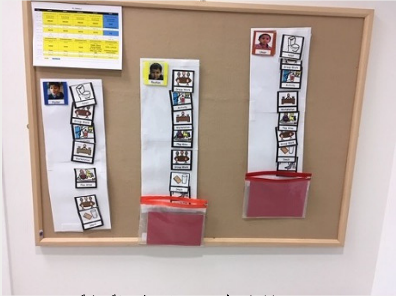
صورة ١: (جدول يومي مستخدم في بيئة صفية (NEWFIELD SCHOOL, 2022)