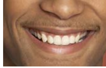
صورة توضح الثنية والرباعية والناب والضاحك

الضَّاحِكَةُ ( Premolar ) من الجذر ضحك يَضْحَكُ ضَحْكَاً وَضَحِكَاً وهو كلُّ سِنَّ تَبْدُو عِنْدَ الضَّحْكِ فِي الْحَدِيثِ : ( مَا أَوْضَحُوا بِضَاحِكَةٍ ) أَي مَا تَبَسَّمُوا ، وَ يُقَالُ ( أَضْحَكَ اللَّهُ سِنَكَ ) وَتَقْصِدُ بِهَا : الدَّعَاءُ بِإِدَامَةِ الْفَرْحِ وَالسَّرُورِ وَالِابْتِسَامَةِ مَعَ ظُهُورِ الْأَسْنَانِ حَيْثُ أَنَّ الْأَسْنَانَ لَا تَضْحَكُ . أَمَا قَوْلُهُ تَعَالَى : ( فَضَحَّكَتْ فَبِشْرِنَاهَا بِإِسْحَقٍ ) فَسِرَ عَلَى مَعْنَى الْعَجَبِ أَي عَجِبْتُ مِنْ فَرْعِ إِبْرَاهِيمَ وَقَالَ بَعْضُهُمْ : هَذَا مَقْدَمٌ ، وَمُؤَخَّرُ الْمَعْنَى فِيهِ عِنْدَهُمْ : فَبِشْرِنَاهَا بِإِسْحَقٍ فَضَحَّكَتْ بِالْبِشَارَةِ . الضَّاحِكَةُ مِنَ الْأَسْنَانِ هِيَ الضَّرْسُ يُلِي النَّابَ جَمْعُهَا ضَوَاحِكٌ وَعَدَدُهَا أَرْبَعَةٌ أَضْرَاسٌ .