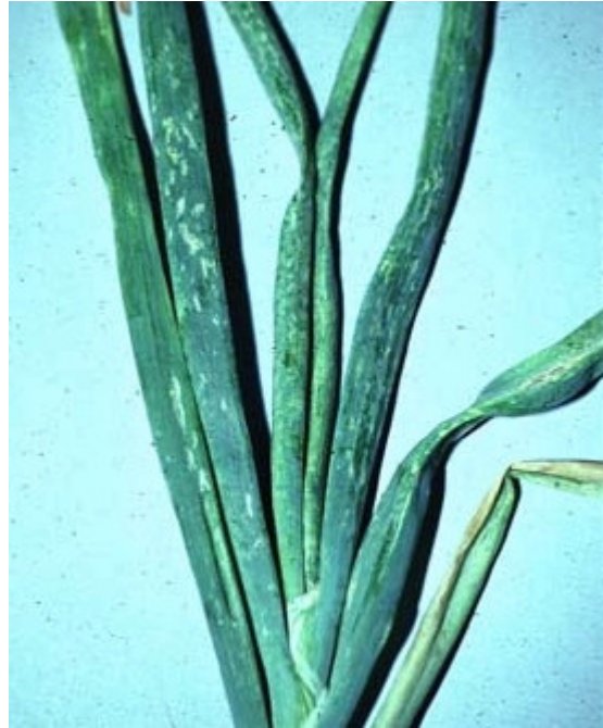
مظهر إصابة تربس البصل