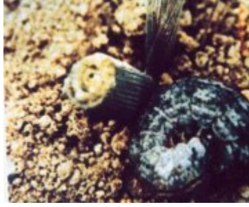
البرقة ومظهر الإصابة بالدودة القارضة

http://images.google.com.sa/imgres?imgurl=http://www.kenanaonline.com/figure