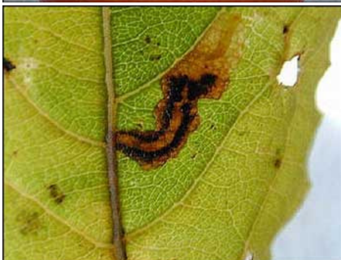
آثارها على الورقة

http://forum.zira3a.net/showthread.php?t=798