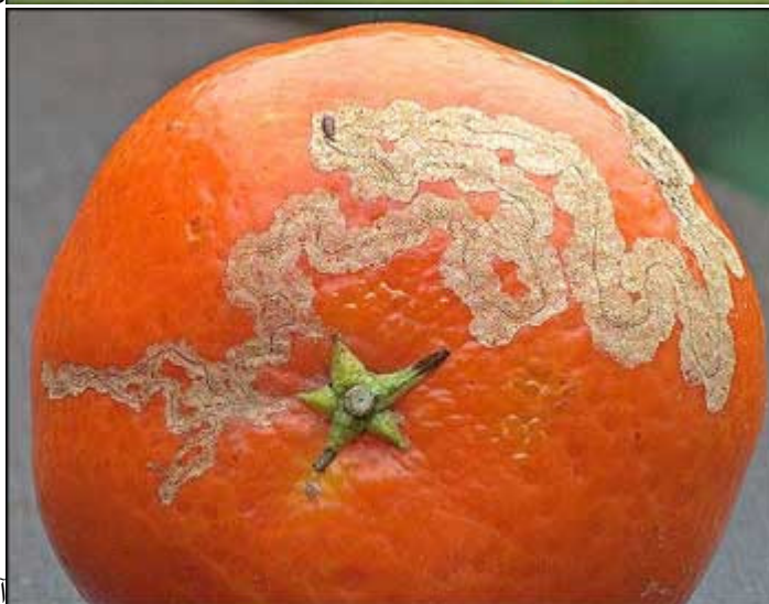
آثارها على ثمرة الحمضيات