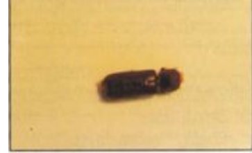
الحشرة الكاملة لثاقبة جريد النخل

عائلة الثاقبات: Fam. Bostrichidae ثاقبة جريد النخيل: Phonapate frontalis