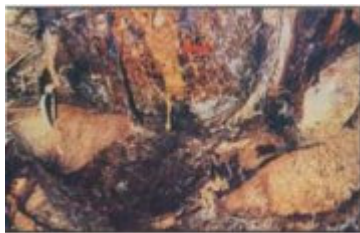
العصارة الناتجة عن الإصابة بسوسة النخيل الحمراء