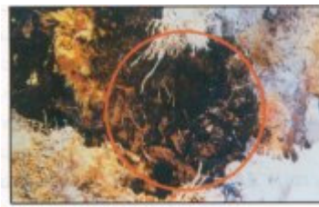
في الصدر الذي يلحق بالأنسجة الداخلية للشخلة المصابة بالسوس