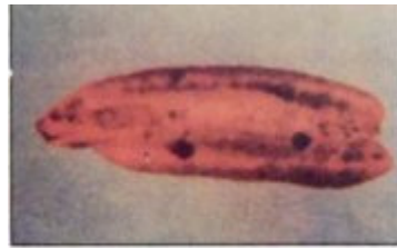
مظهر الإصابة بشاغبة نواة البلح

خنفساء نواة البلح: Coccotrypes dactyliperda