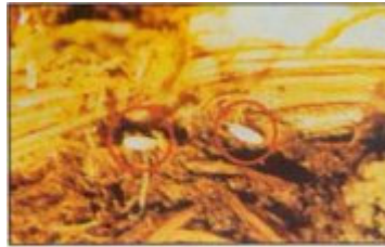
بيض سوسة النخيل