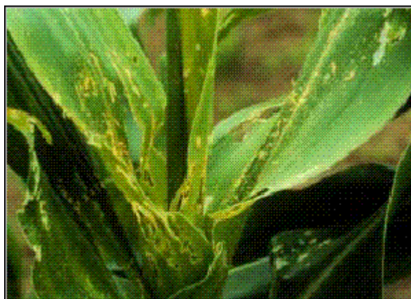
Figure 1. Stemborer damage to a maize plants.