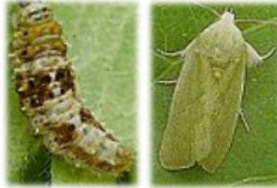
Earias insulana Boisduval ذيفت הכותנה