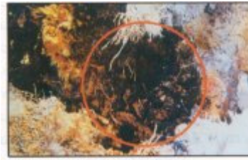
على الظهر التي يلحق بالأنسجة الداخلية للتخلية المسببة بالسوسة