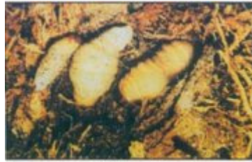
يرقات سوسة النخيل