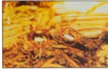
بيض سوسة النخيل