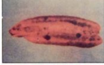
مظهر الإصابة بشلل نواة البلح

خنفساء نواة البلح: Coccotrypes dactyliperda