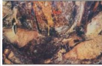
العصارة الناتجة عن الإصابة بسوسة النخيل الحمراء