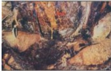
العصارة الناتجة عن الإصابة بسوسة النخيل الحمراء