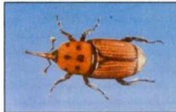
الحشرة الكاملة لسوسة النخيل الحمراء