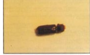
الحشرة الكاملة لثاقبة جريد النخل