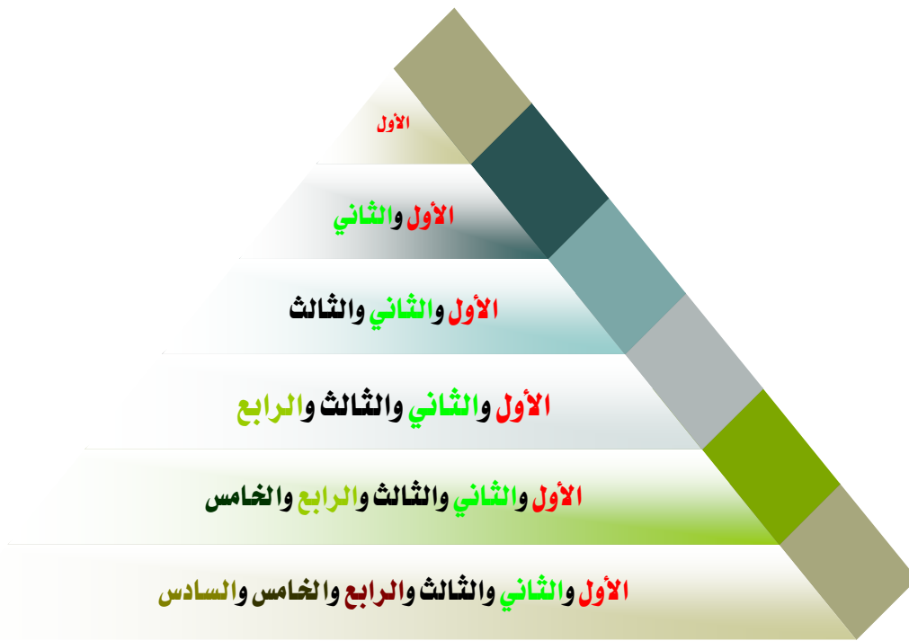
شكل رقم (١) هرم صيانة الأهداف القصيرة المدى

مثال: إذا اجتاز الطالب الهدف قصير المدى الثاني يتم إعطائه تمرين صيانة للهدف القصير الأول، وعند اجتياز الهدف القصير الثالث يتم إعطاؤه تمرين صيانة للهدفين القصيرين (الأول والثاني)، وعند اجتيازه الهدف الرابع يتم إعطاؤه تمارين صيانة للأهداف (الأول، والثاني، والثالث) وهكذا شاهد الشكل رقم (١) هرم صيانة الأهداف القصيرة المدى، على أن تكون تمارين الصيانة في حصة مستقلة عن حصص الجدول وتكون في حصص الجدول المتبقية. (يفضل عمل تمارين مجدولة لكل طالب بهدف الممارسة وإبقاء الطالب في جو المهارة ويتم ذلك بالتعاون مع الأسرة، حتى لو تم إقفال الخطة للطلاب لتكون هذه التمارين عند تطبيقها بفعالية كافية بإذن الله لتعميم المهارة )