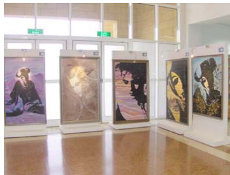
- ( )