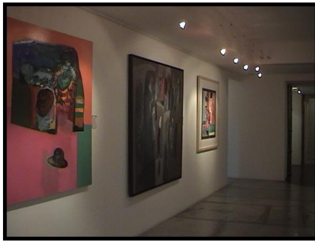
( ) ( )