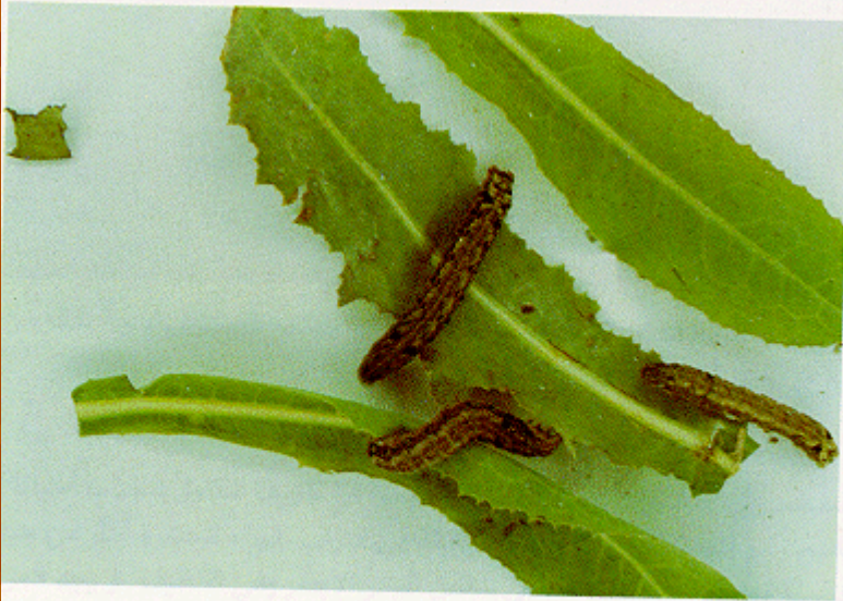
شكل ٥ - ديدان الجرسيم الكبرى تختلف عن باقي الديدان بوجود الخطوط الرمادية والنقط السوداء .