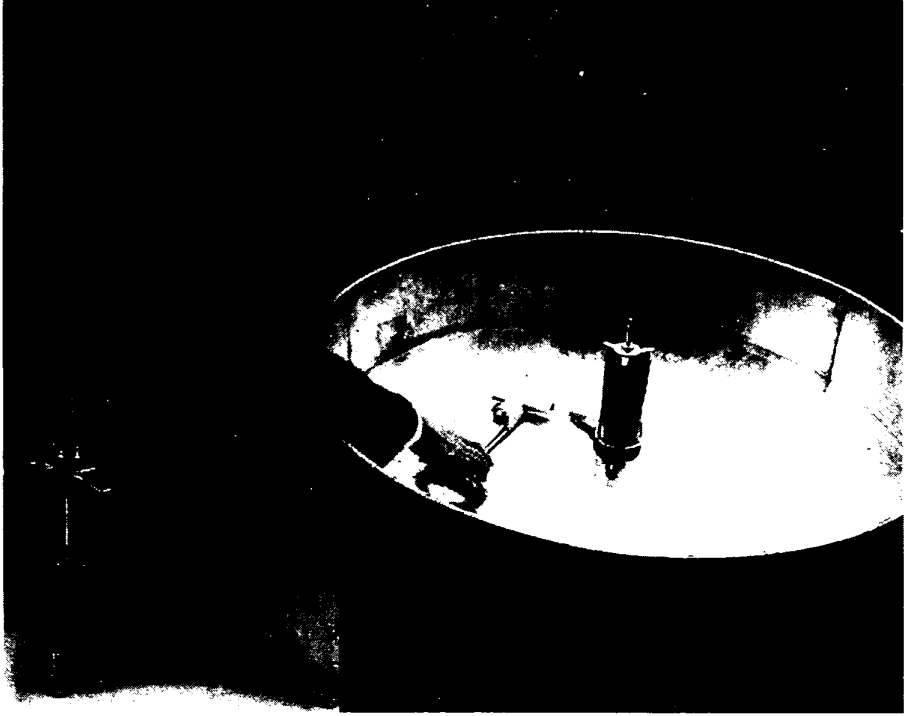
شكل (١) وعاء البخار