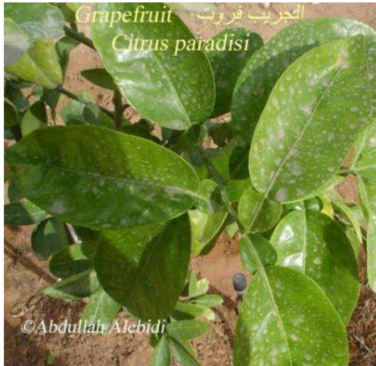
Grapefruit الجريب فروت Citrus paradisi